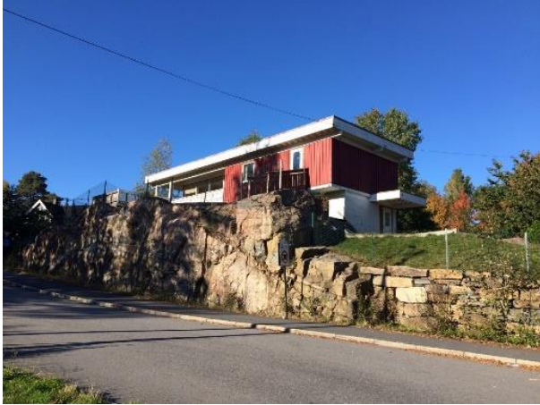
«Rektorboligen» like ved skolen

Men fra skoleåret 1985/86 var elevtallet på vei nedover, og fra august 1987 ble lærerboligen «stilt til disposisjon for barnehagenemnda» og brukt til korttidsbarnehage.