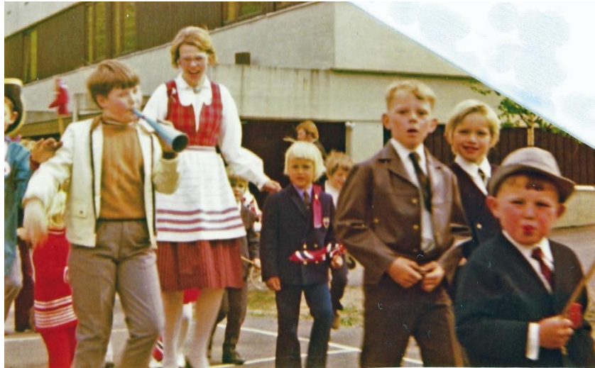
Første 17.mai tog på Justvik (1972) runder skolebygningen.

Men siden har toget både gått inn Dalsveien, opp Kvernhusheia og de siste årene runden ved kirke og bydelshus. Og Oddernes skolemusikk-korps har vært med i toget. Og bortsett fra ett år da Justvik skole deltok i skoletoget i Kristiansand, har toget og all feiring foregått fra skolegården på Justvik.