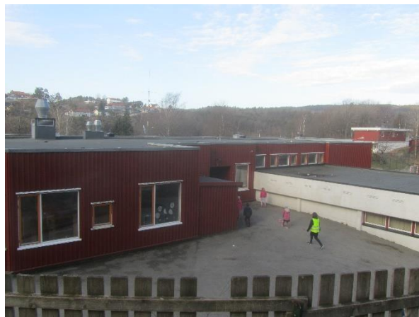
Tilbygget med lærernes arbeidsrom og tilbygget med SFO (1998)