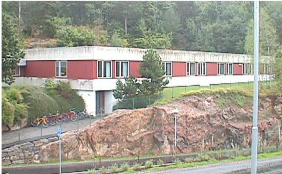
2.bygetrinn i forlengelsen av hovedbygget til venstre

Disse forhold skulle ligge vel til rette som et viktig redskap til å forme våre elever til: gagnlege og sjølvstendige menneske.