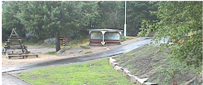
Fuglefjellet og pratebua

En av de mest populære sangene som elevene fremførte under dugnadene var «La det svinge, la det rock'n roll.» Det var Bobby Socks bidrag i Grand Prix, som de vant med i 1985.