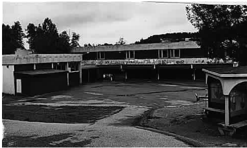
Skolegården med pratebua

Trivsel i skolegården var resultatet med sittetårn, ronser i 5-kant, sitteplasser under tak og etterhvert «taubane». Også en hinderløype ble det plass til. Prosjektet sto ferdig i 1985/86.