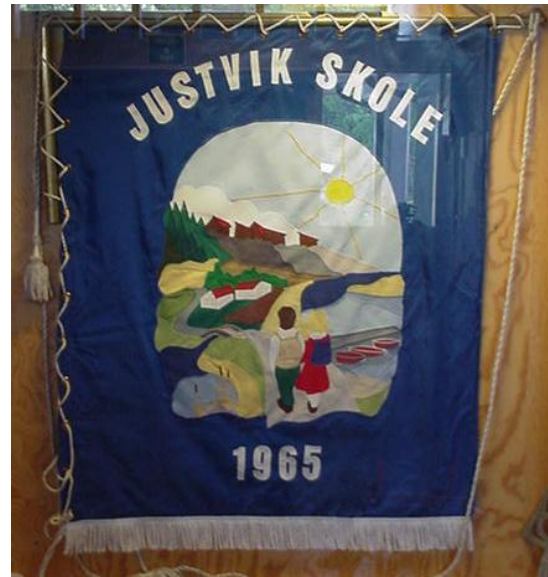
Skolens nåværende fane – laget i 1987

17.mai 1987 var fanen klar til bruk for første gang.