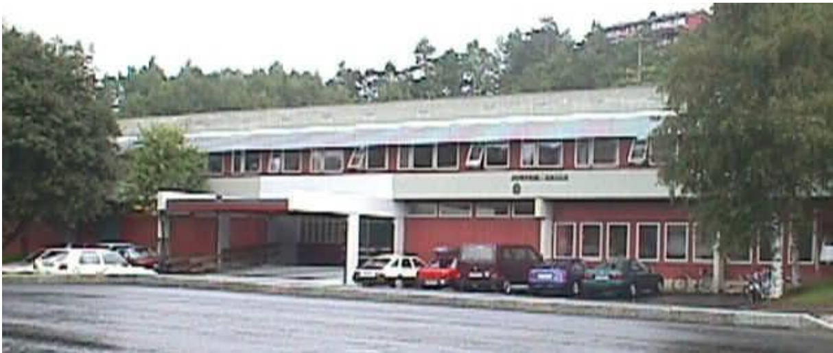
Justviks andre skolebygning (1965-2015)

Det gamle skolehuset ble i en periode fra 1965 brukt som menighetshus i Tveit menighet på Justvik.